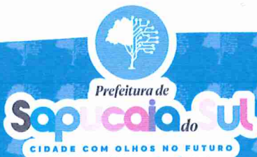
VOLMIR RODRIGUES Prefeito Municipal