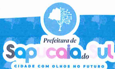
VOLMIR RODRIGUES Prefeito Municipal