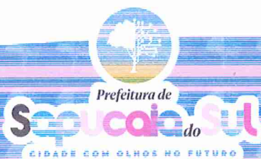
VOLMIR RODRIGUES Prefeito Municipal