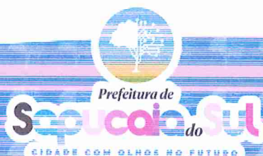
VOLMIR RODRIGUES Prefeito Municipal