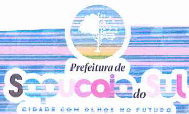
VOLMIR RODRIGUES Prefeito Municipal