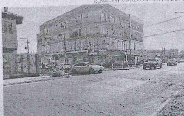
Esquina da Jorge Assun com a Caramuru, no bairro Primor