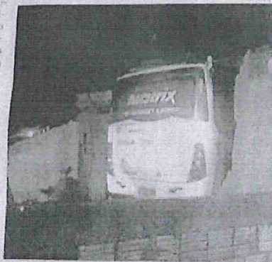
ACCIDENTE: motorista e os três passageiros não se feriram