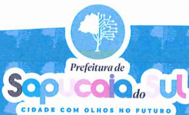
VOLMIR RODRIGUES Prefeito Municipal