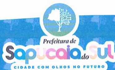
VOLMIR RODRIGUES Prefeito Municipal