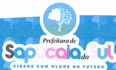
VOLMIR RODRIGUES Prefeito Municipal