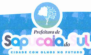
VOLMIR RODRIGUES Prefeito Municipal